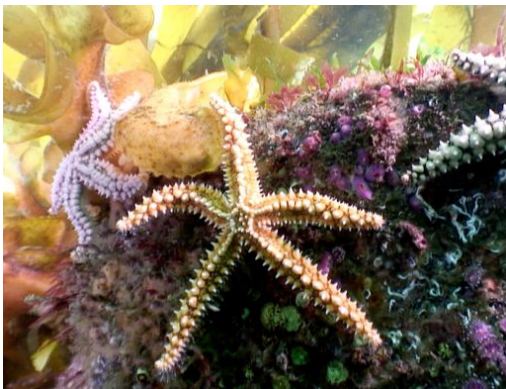
Etoile de mer