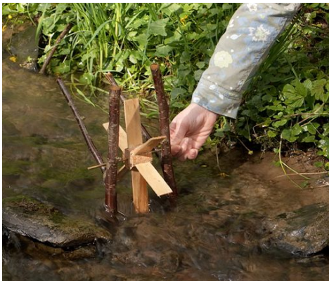
Le sens du courant